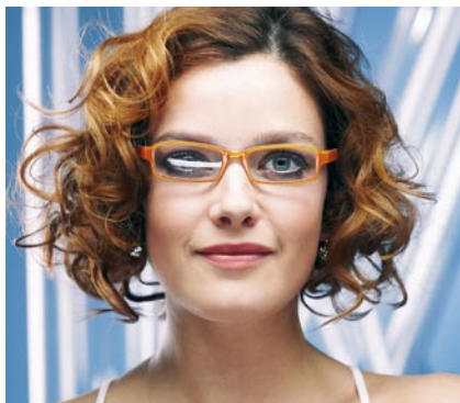
Nella foto la donna indossa occhiali con una lente trattata antiriflesso, e una senza