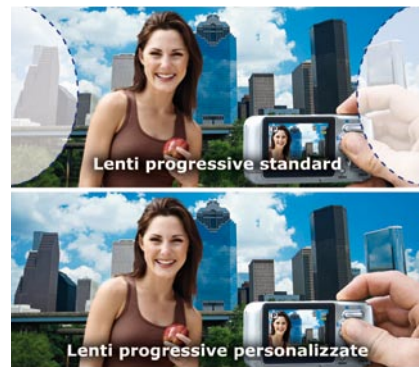
Le lenti progressive nella comparazione tra lenti personalizzate e standard

Ma il tuo ottico Vision Adria può fare molto di più: può far progettare delle lenti specifiche SOLO per il tuo occhiale. Questa progettazione si chiama "PRECALIBRATURA" e permette di costruire le lenti secondo alcuni algoritmi matematici particolari che riducono gli spessori e il peso fino anche al 50% (la percentuale è variabile in relazione alla prescrizione) rispetto alle tecnologie standard. Chiedi al tuo ottico Vision Adria se è possibile "progettare" le lenti anche nel tuo caso specifico e prova la sensazione di un occhiale costruito solo per te.